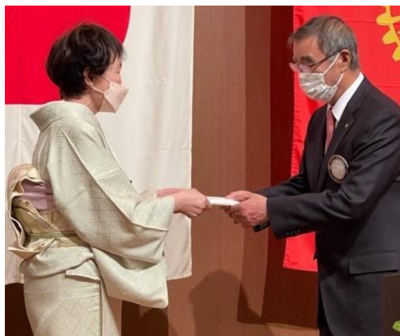
副会長1年間お世話になります