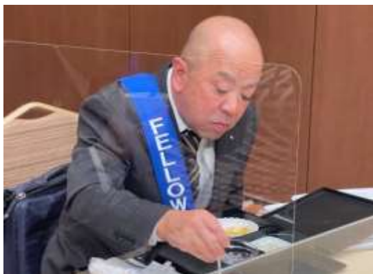
倉茂さん慣れましたか？