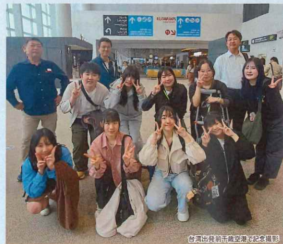
台湾出発前千歳空港で記念撮影