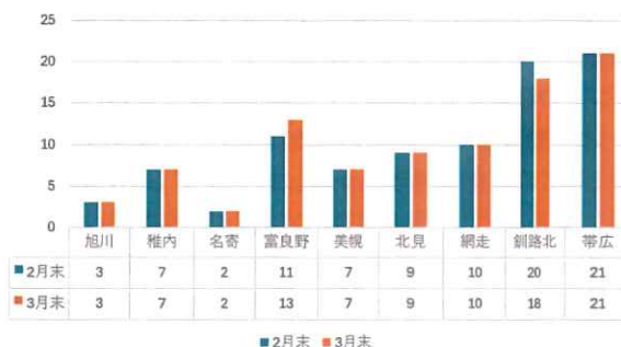
地区別の3月会員数