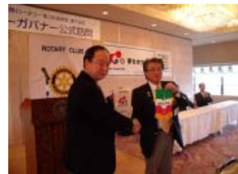
北上会長・足立ガバナー（バナー交換）