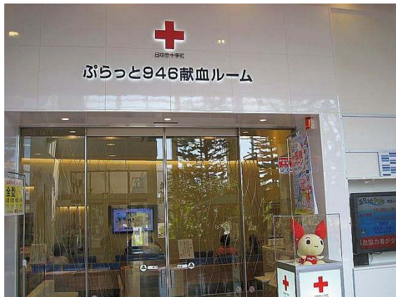
イオン釧路昭和店 1F