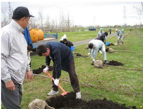
五月場所も終わり、常に目は力士スカウトか、の親方？