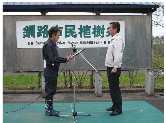
釧路市より、森江会長へ感謝状進呈