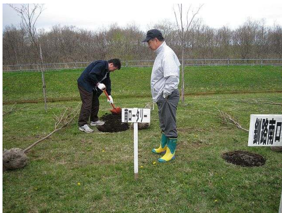
長倉会員は何を・・・？まさかちゃんこ鍋