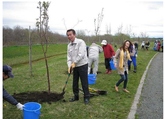
森江会長 談?私が植えた樹も花も、 枯れた事がない・・・と!