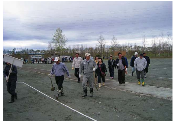
釧路南RC会員、今年度の植樹場所へ移動中