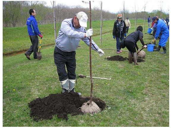
嫌いな言葉は「手抜き」と、クラブ 会務もゴルフも真剣な木内会員