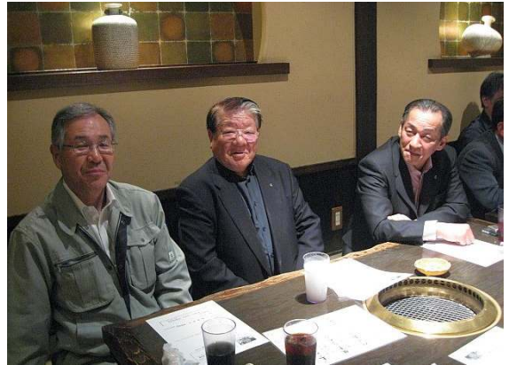
亀岡会員・清水会員・木内会員