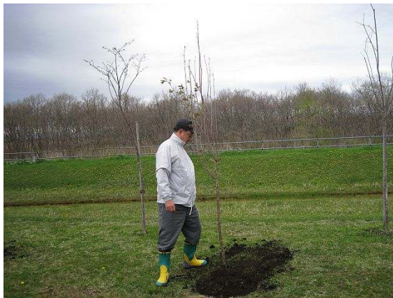
鉄砲柱にはまだ時間が掛ると、長倉親方？