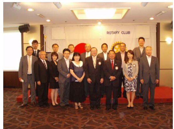
今年も宜しくと全員で1枚

行動できるようなクラブにしたいと考えています。また、「ローターアクトクラブ」という世間での認知度の低さ、会員の減少、現会員のクラブ活動の意味の理解の差など、問題点も多くあります。そのすべてを少しずつ解決し、意味のあるクラブ活動ができるよう努力していきたいと思っております。また、釧路南ロータリークラブの皆様にも、引き続き弊クラブへ、ご指導、ご鞭撻いただきますよう、お願い申し上げます。最後に、釧路南ロータリークラブ様、会員の皆様のますますのご健勝をご祈念いたしまして、表敬の挨拶とさせていただきます。今年度1年間、よろしくお願い申し上げます。