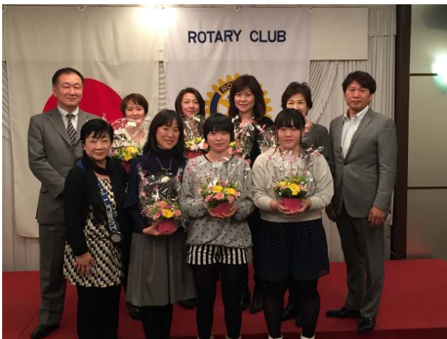
長倉会長より女性陣へお花を贈呈