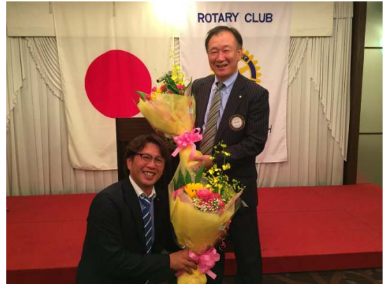
会長・幹事おつかれさまでした。