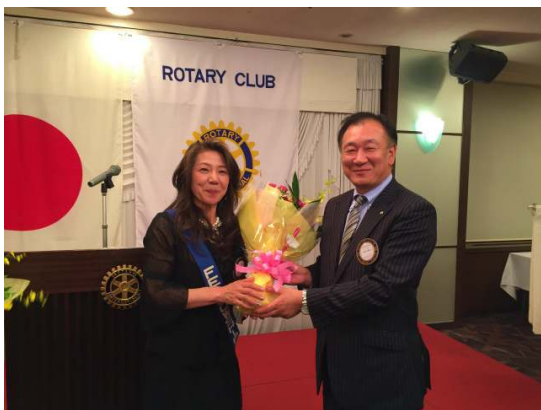
長倉会長へ花束贈呈