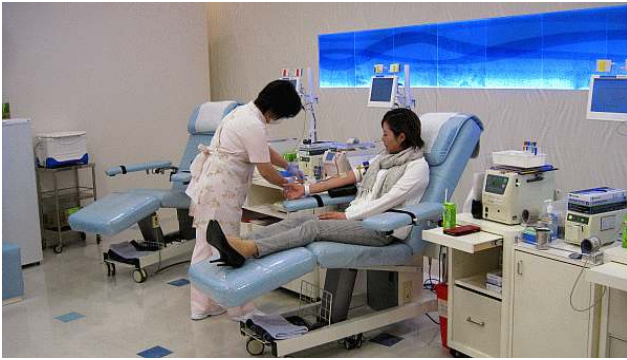
冷静に 400ml 澤山会員