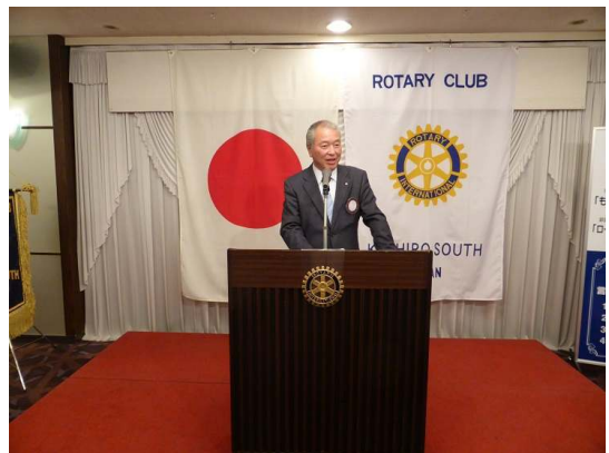
長江パストガバナー補佐 締め言葉