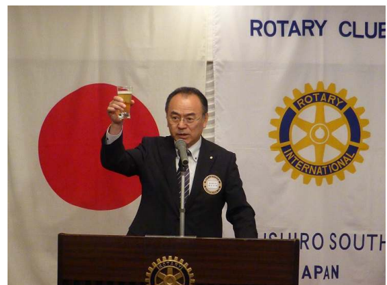
乾杯の音頭 福井パストガバナー補佐