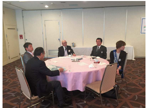
食事中のショット