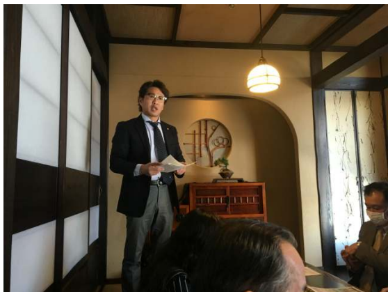
上川原会員より講演をいただきました。