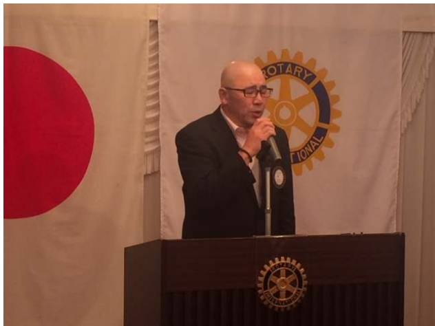
◆佐藤次年度S A A