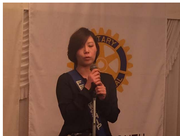
◆澤山次年度副幹事