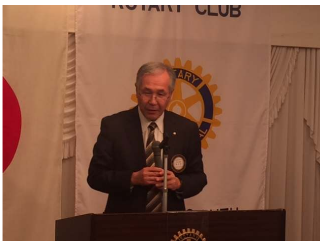
◆亀岡次年度会長エレクト