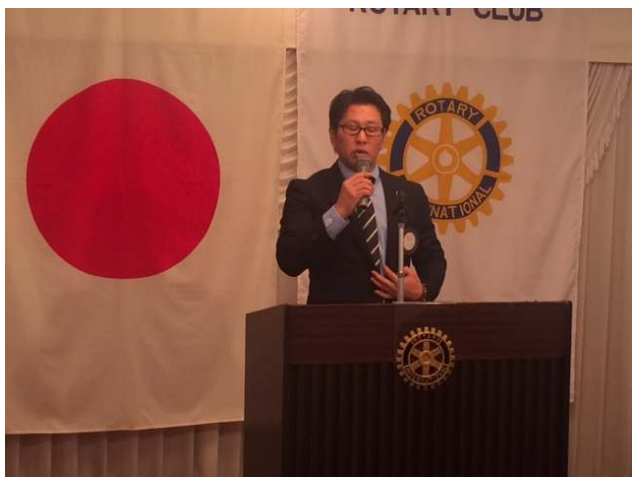
◆次年度会長 上川原会員