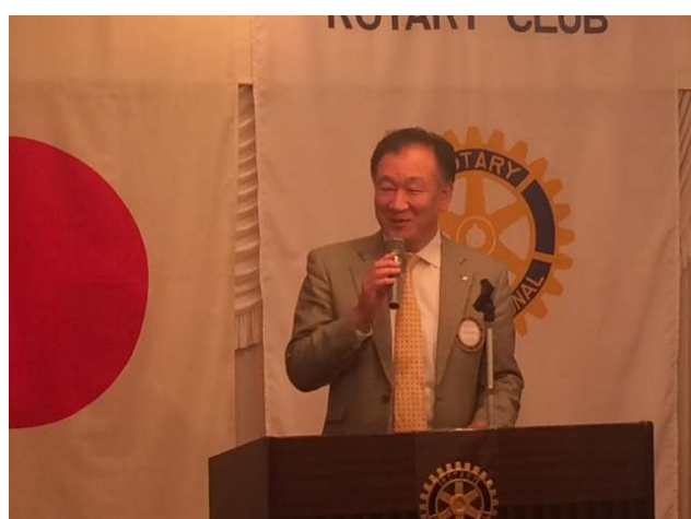
◆長倉次年度財団米山委員長