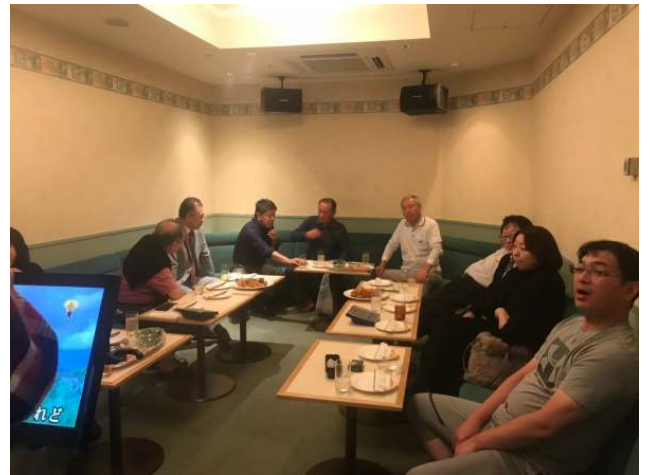
二次会会場カラオケルームにて