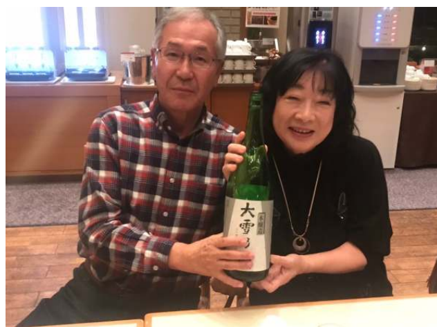
亀岡会長と工藤副会長