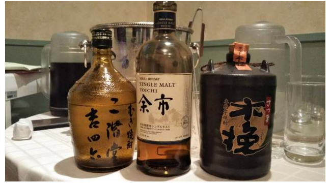
澤山親睦活動委員長から差し入れのお酒