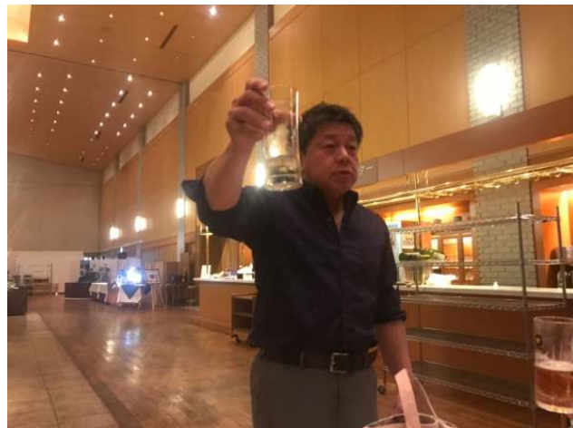
前田エレクトの乾杯