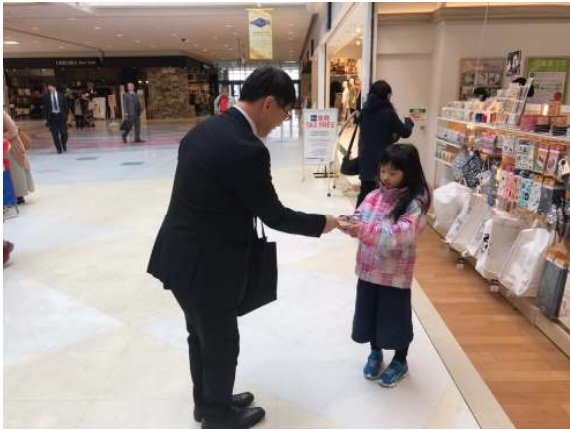
長江会員「大人になったら献血してネ」