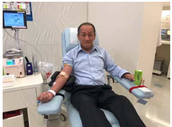
木内会員「今回は針がうまく刺さったみたい」