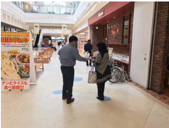
早津会員「献血おねがいします」