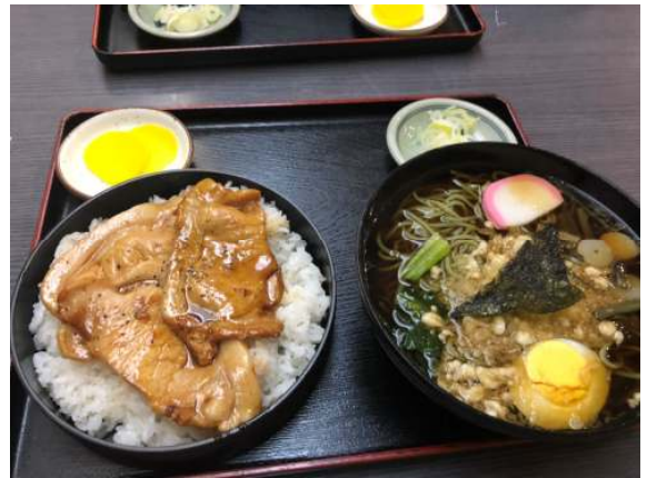
「これは食べ過ぎでしょ」