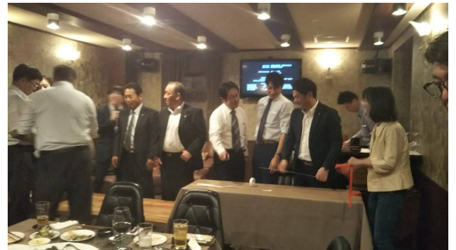
ゲームにて盛り上がる会員一同