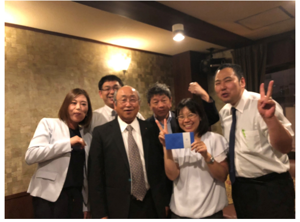
ゲームにて栄光の優勝を獲得したAチーム