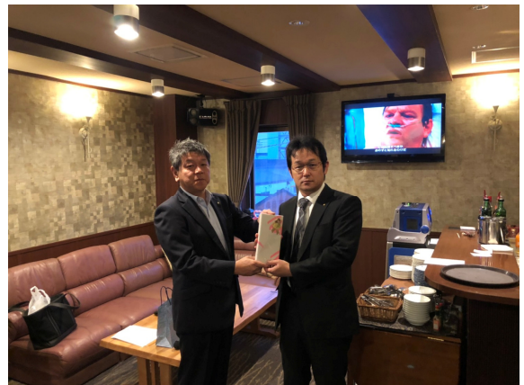
前田会長より舟山会員へ記念品贈呈