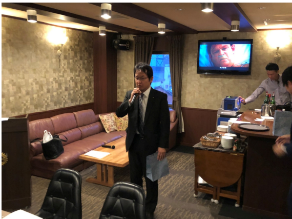
舟山新入会員より一言挨拶