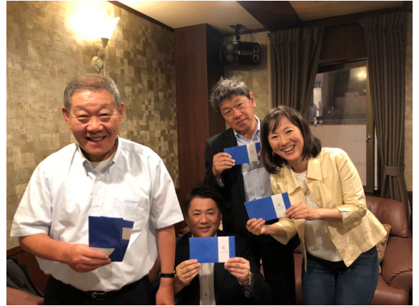
ゲームにて準優勝獲得のDチーム