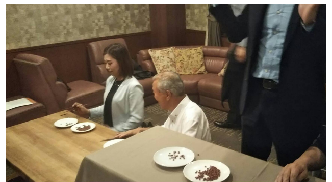
ゲームに余裕を感じる澤山会員