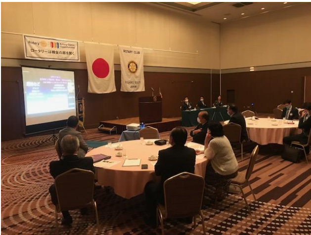
ガバナー公式訪問会場