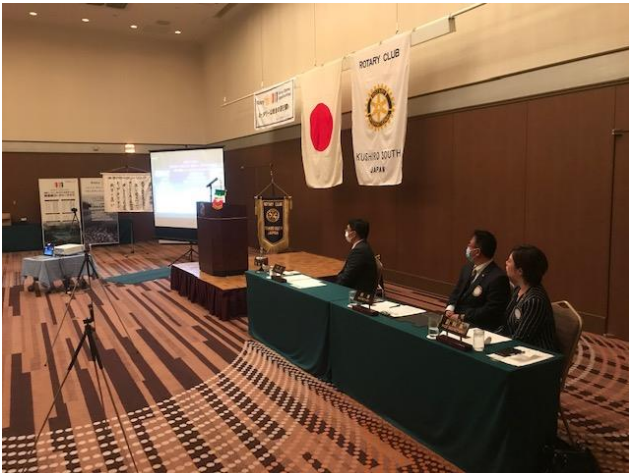
ガバナー公式訪問会場