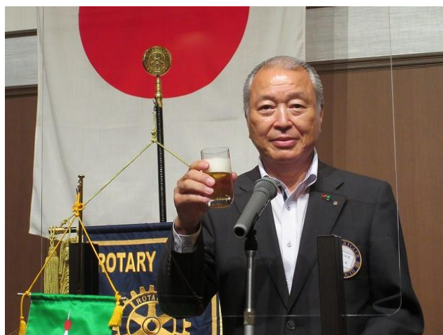
乾杯 長江 勉会員