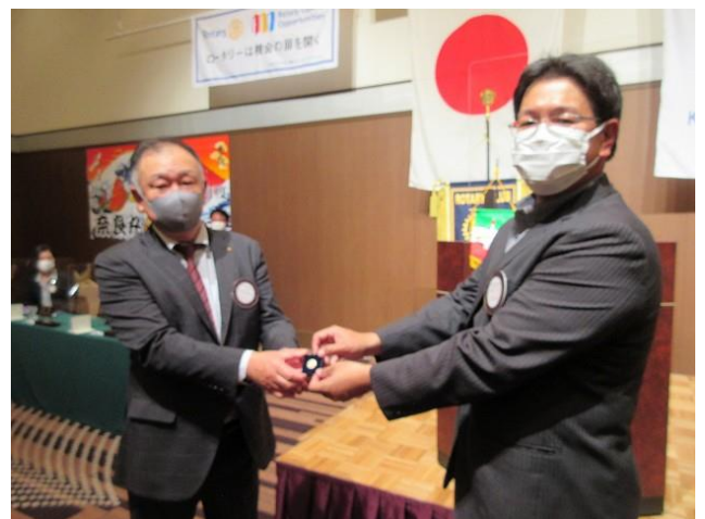
記念品贈呈 長井会員