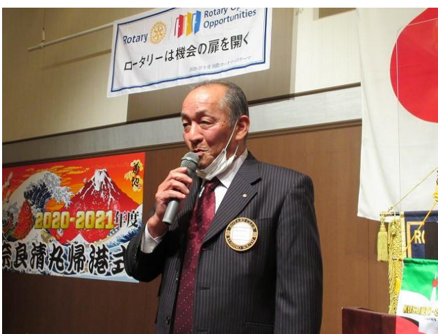
締め挨拶 木内会員