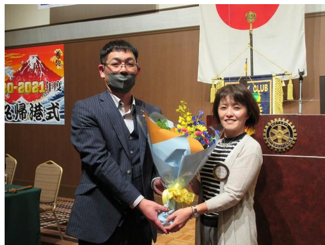
奈良会長と亀井会長エレクトがバッジの交換と花束贈呈