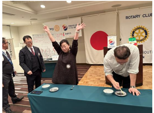
工藤会員の勝ちです