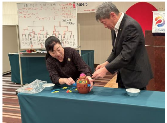
黒ひげゲーム 工藤会員も恐る恐るです