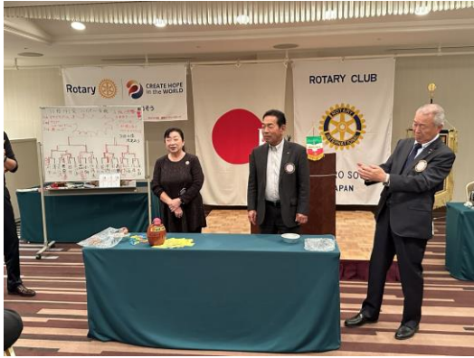
難しいゲームでした