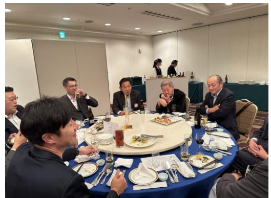
難しい話をしているのかな？