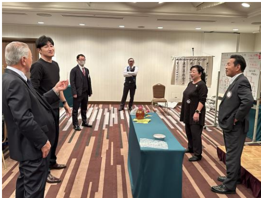
中々答えが出てこないですね