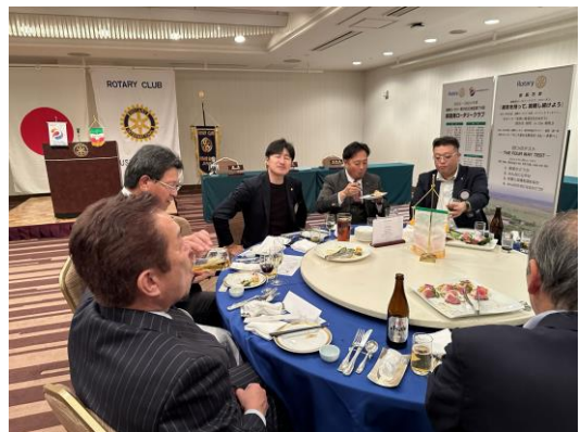
テンション低いですね・・・