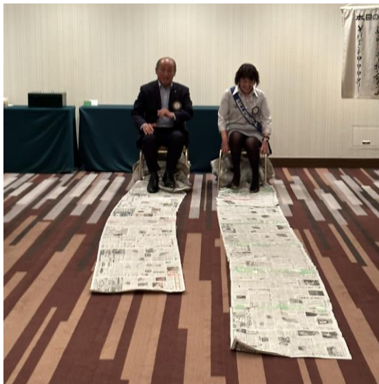
木内会員・亀井会員接戦です