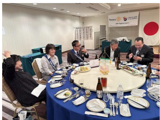
皆さん楽しそうですね！！