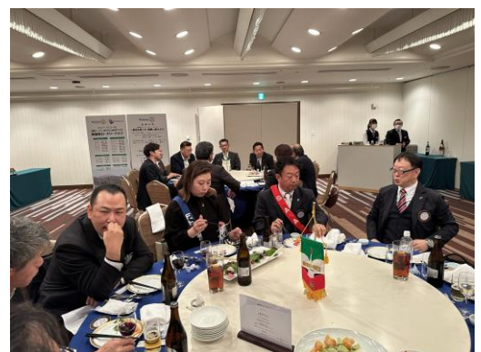
会員の談話・・・