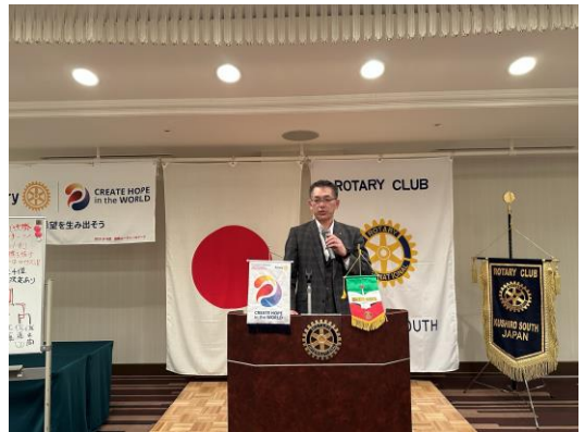
奈良会員 締め音頭